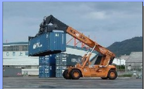
リーチスタッカー