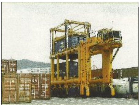
ストラドルキャリア