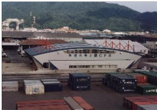
C F S (コンテナフレートステーション)